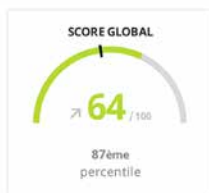
Répartition des scores globaux