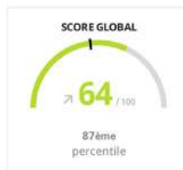
Répartition des scores globaux